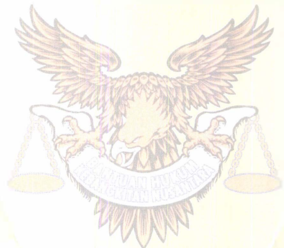
SAHAT PARTOGI FRANSISCUS XAFERIUS, S.H.